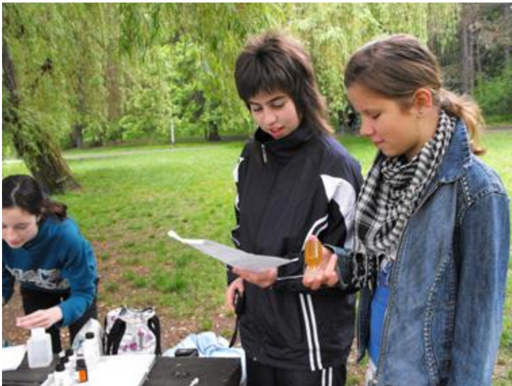
Víz minta elemzés a Békás tónál