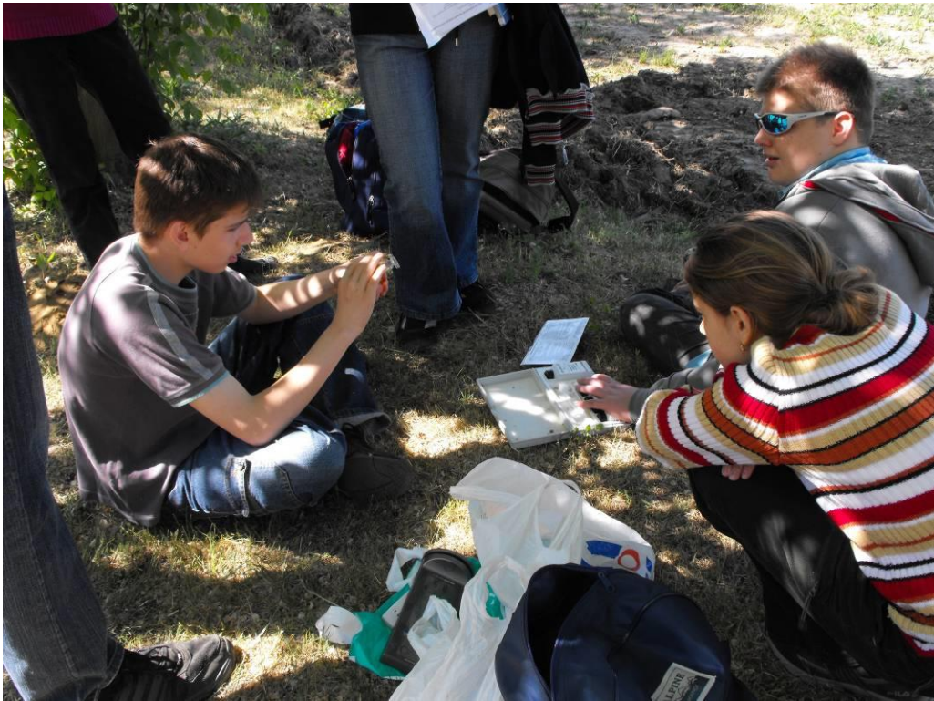
A szinkron-napi teregyakorlat