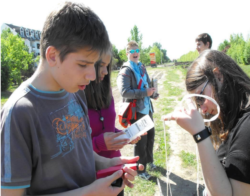
A Tóció-pataknál hidrológiai vizsgálat