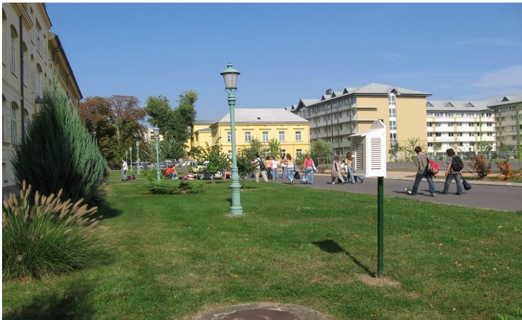
Mikroklíma mérő állomás gimnáziumunk parkjában