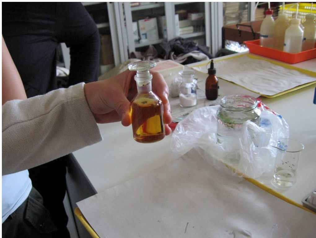
Víz minta elemzés a biológia szertárunkban